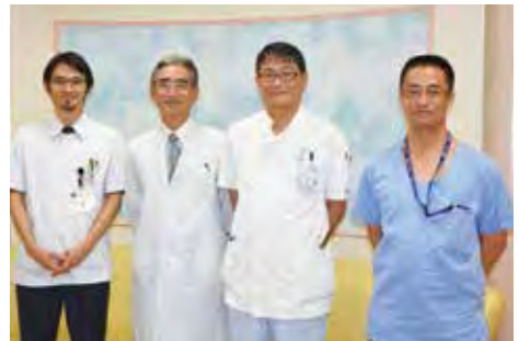
左から、隈内科部長、隈院長、行實副院長、今村外科部長

1987年に透析専門として開業し、『明るく・楽しく・良い医療』をモットーに、地域医療に取り組んできました。高齢社会となり、独り暮らしや老老介護で通院・退院困難となった方や、透析患者様で老健や特養に入れず行き場がないという不安を抱える方が増えているのを実感し、その受け皿になりたいとの思いから、2011年、クリニックの隣にサービス付き高齢者向け住宅「メディケアホーム南福岡」を開設しました。クリニックとの連携により、24時間体制で入居者の暮らしをサポートし、透析・胃ろう患者様も安心してお過ごしいただけます。ケアプランセンター、通所リハビリ(デイケア)、訪問介護を併設し、医療と介護が連携することで、患者様の安心の暮らしをサポートします。